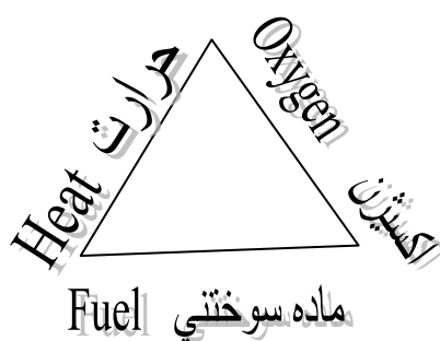
شکل شماره ۱

آتش نتیجه‌ی یک واکنش شیمیایی است که از ترکیب اکسیژن، حرارت و ماده‌ای قابل اشتعال به دست می‌آید، یعنی اکسیژن با کربن اجسام ترکیب شده و تولید دی‌اکسید کربن ( CO_2 ) و گاهی هم تولید منواکسید کربن (CO) نموده و در اثر این فعل و انفعال شعله و حرارت تولید می‌نماید. امروزه در دنیای متمدن برای تبادل اطلاعات و افکار مسایل آتش‌نشانی رابطه‌ای کامل برقرار است و نشان مخصوص آتش‌نشانی (مثلث) برای آتش‌نشانی‌های دنیا شناخته شده و تقریباً به صورت نشان بین‌المللی درآمده است. چنانچه سه عامل اکسیژن، حرارت و ماده‌ی سوختی در کنار یکدیگر قرار گیرند، مثلث پدید می‌آید که آن را مثلث آتش گویند.